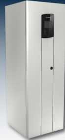
Batteriespeicher ermöglichen den Verbrauch von Solarstrom auch am Abend und in der Nacht.