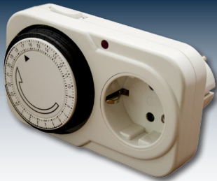
Zeitschaltuhren als einfachste Form des Lastmanagements.

Insbesondere Verbraucher, die nicht an bestimmte Betriebszeiten gebunden sind, lassen sich so äußerst rentabel direkt mit Solarstrom betreiben. Moderne Technik bringt Verbrauch und Erzeugung in Einklang.