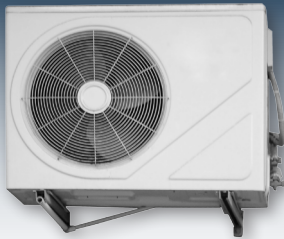
Klimaanlagen und Wärmepumpen eignen sich hervorragend für den Betrieb mit Solarstrom.

Auch durch die Speicherung von Strom kann die Eigenverbrauchsquote weiter erhöht werden. Die sinnvolle Nutzung von Speichern lässt sich aber insbesondere durch sich daraus ergebende Zusatznutzen definieren.