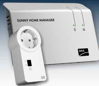
Intelligente Geräte gewährleisten ein vollautomatisches Lastmanagement.