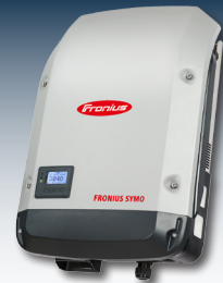
Wechselrichter mit integrierten Energiemanagementfunktionen sorgen für eine maximale Stromausnutzung unter Einhaltung aller Netzanforderungen.