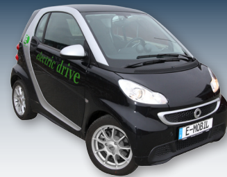
Elektroautos können Solarstrom wirtschaftlich speichern und machen so umweltfreundlich mobil.